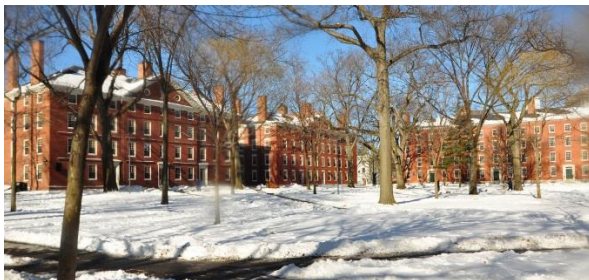
Leitorado da Universidade Harvard integra o PortuBrasil

Apresentaram-se, na ocasião, artistas brasileiros de teatro, capoeiristas e músicos, entre os quais Reco do Bandolim e Choro Livre, que ofereceram uma tarde de chorinho tipicamente brasileiro.