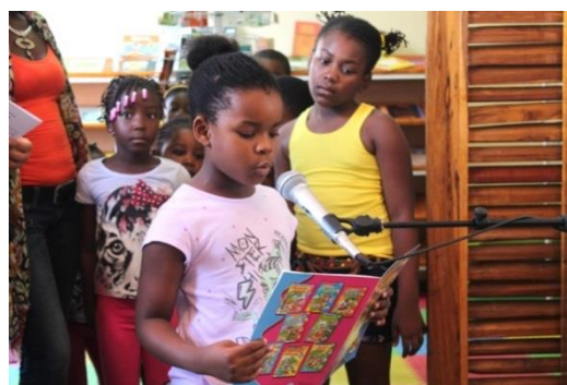
Crianças em contato com a literatura

A programação especial para a inauguração foi feita em parceria com o Orfanato Casa do Gaiato, instituição de referência na África Austral, e com a Escola Portuguesa de Maputo.