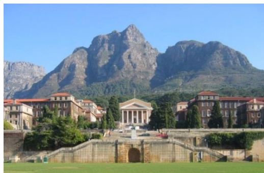
Universidade da cidade do Cabo na África do Sul