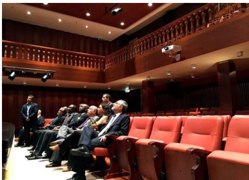
O Ministro das Relações Exteriores, Mauro Vieira, visita nova sede da Casa de Cultural Brasil-Angola

A nova sede do centro cultural ocupará um prédio histórico na região central da capital angolana, reformado com esmero pela Fundação Eduardo dos Santos. O futuro prédio da Casa de Cultura Brasil-Angola contará com salas de aula, biblioteca, espaço de exposições, restaurante e um moderníssimo teatro para 175 pessoas.